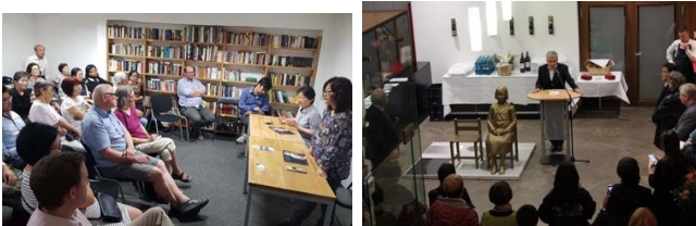
프랑크푸르트 간담회 하우스 암 돔 전시회 오픈

세우기 위해 독일 시민단체인 풍경세계문화협의회와 연대를 이어가며, 활동을 지원하고 있습니다. 지난 6월에는 프랑크푸르트를 방문하여 워크숍과 영화상영, 동포간담회 등을 진행했습니다. 풍경은 일본정부의 끝없는 방해에도 굴하지 않고 프랑크푸르트 중심가에 위치한 카톨릭 하우스 앞에서 오는 1월 중순까지 평화의 소녀상 전시를 개최하고 있으며 독일 주류사회에서 "위안부" 문제를 꾸준히 알리며 지지기반을 넓혀가고 있습니다.