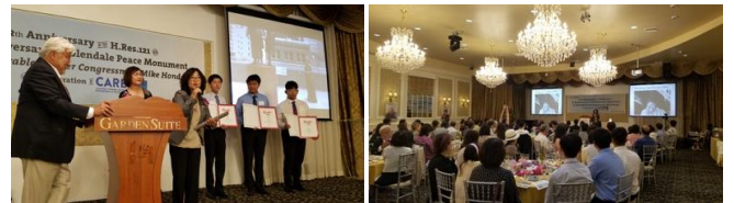
1 등을 수상한 최솔 팀

경연대회에 이어 올해 갈라디너에서는 KAFC 의 새 이름 CARE(위안부행동)을 발표하면서 "위안부" 비디오 경연대회를 개최하여, 고등학생 및 대학생들이 위안부 문제에 더욱 관심을 가지게 하였고, 수준높은 비디오 작품들을 선정하여 상을 수여하였습니다.