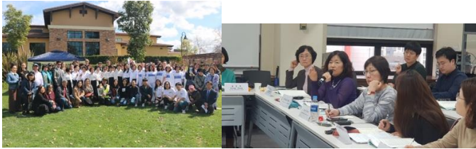
국제여성의 날 다민족 쉼기대회 | UNESCO 국제연대회의(서울)

여성의 날, 일본의 방해로 유네스코 등재가 지연되고 있는 2,744 건의 "위안부의 목소리" 기록물 등재를 촉구하는 다민족 쉼기대회를 열고 동영상 발표했습니다. 또한 샌프란시스코 위안부정의연대와 함께 서울에서 열린 유네스코 기록물 등재를 위한 국제연대위원회 회의에 참석하여 2020년에는 반드시 "위안부" 기록물 유네스코 등재가 이루어지도록 공조를 다짐했습니다.