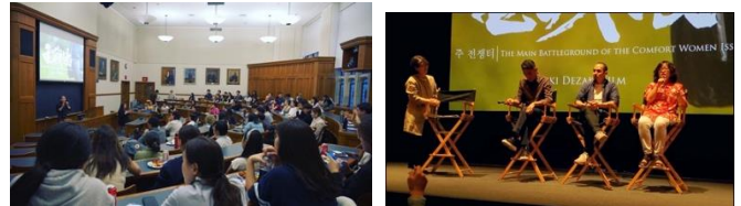
예일대 상영회 후 질의 응답 | UCLA 패널 디스커션

미 동부 배사 칼리지, 코네티컷 대학교, 예일 대학교, 뉴욕 퀸스 칼리지, 뉴욕 대학교, 조지 워싱턴 대학교, UCLA, 노스리지 대학교, USC, 엘에이 커뮤니티 상영회